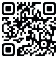
心理診断 プログラム